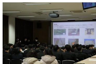
( 会場の様子 )