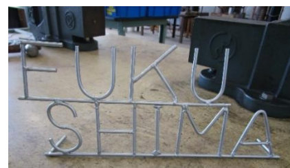
F 班 溶接の指導で使用した題材