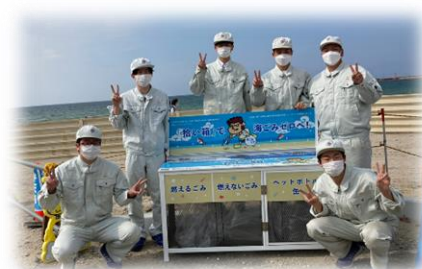
C 班 「拾い箱」