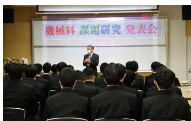
〈 開会式 〉