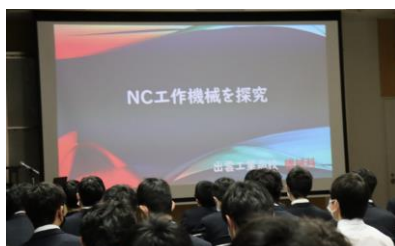
〈 発表会の様子 〉