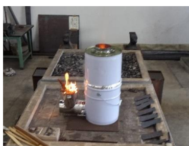
A 班 ロケットストーブ