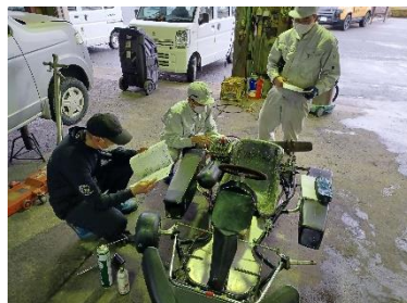
E 班 レーシングカートの整備