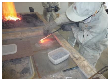
D 班 地金とハガネの鍛接