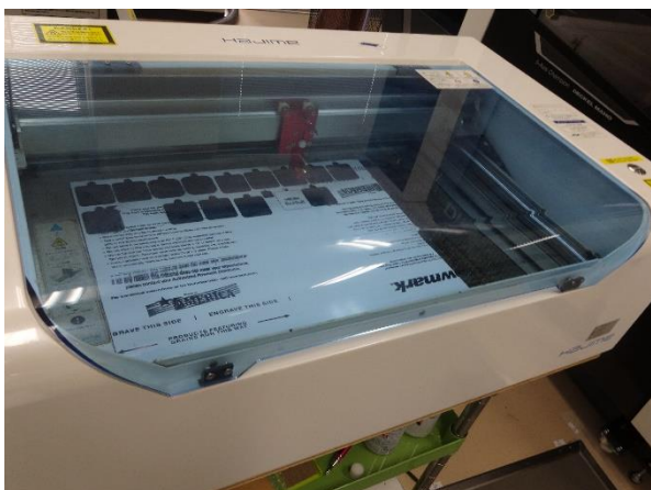
CAM から加工機にデータを送り、試作しました

先週までに作成したCADデータと組み合わせ、試作をしましたが 問題発生! 出来たものが小さいのです!! 色々原因を調べたら、CAD→Illustratorのデータ変換で変な倍率がかかっており、それを直したら設計通りの寸法になりました。ソフトウェアがVerアップされると、たまにこんなことが起こります。