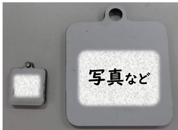
(左)倍率NGなもの(幅15mm) (右)正常な倍率(幅40mm)