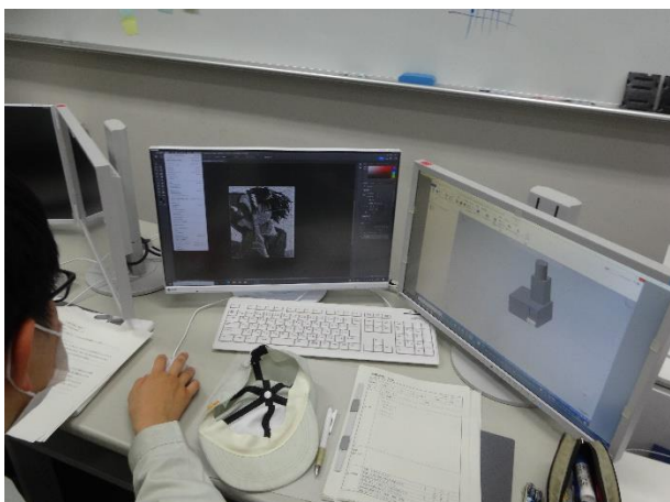
パソコンの画面を2つのディスプレイに表示することも可能

今まで触れることのなかったベクター画像ソフトウェアは新鮮なようでした。家電の取扱説明書や企業ロゴなどにも使われており、このソフトウェアでの制作物は意外と目にしています。