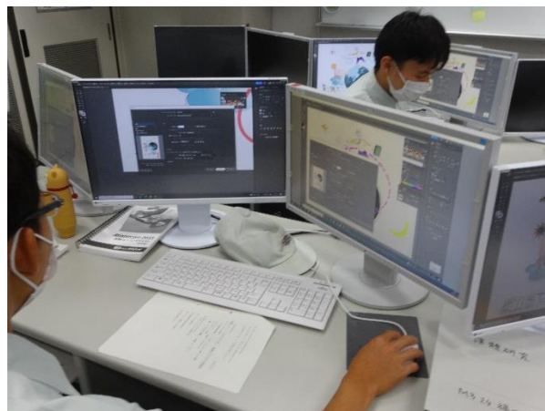
先生の画面を右側に映しながら、操作練習

今まで触れることのなかったベクター画像ソフトウェアは新鮮なようでした。家電の取扱説明書や企業ロゴなどにも使われており、このソフトウェアでの制作物は意外と目にしています。