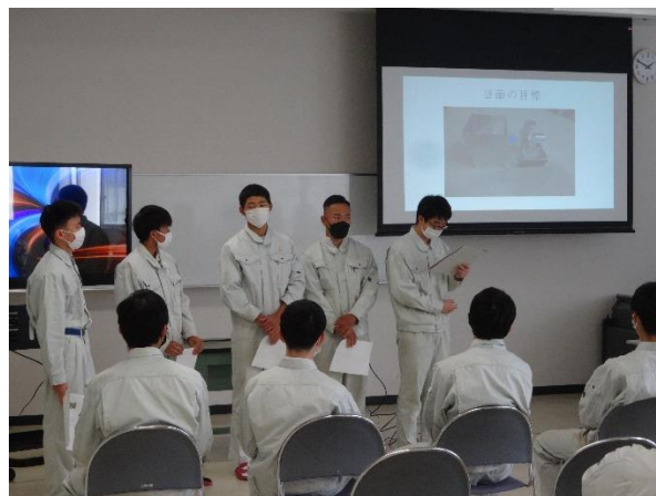
機械NC工作機械を探究班の発表の様子

発表会にはプレゼンテーションソフトを使い、自分たちの考えを表現 先生や生徒からの質問や意見を、これからの研究や発表に生かしていきます。