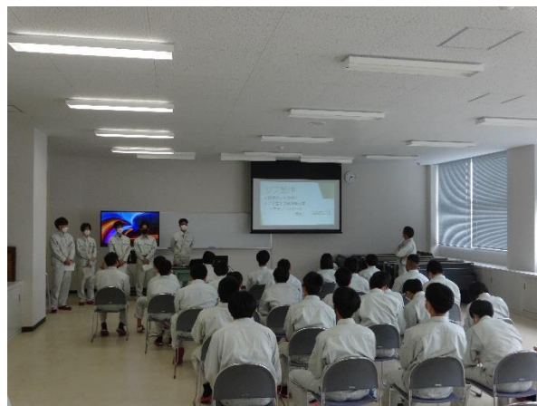
換気が十分な環境で発表会です