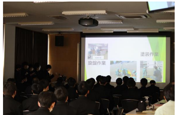
D 班 作業内容の説明