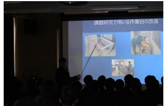
F 班 改良ポイントの説明