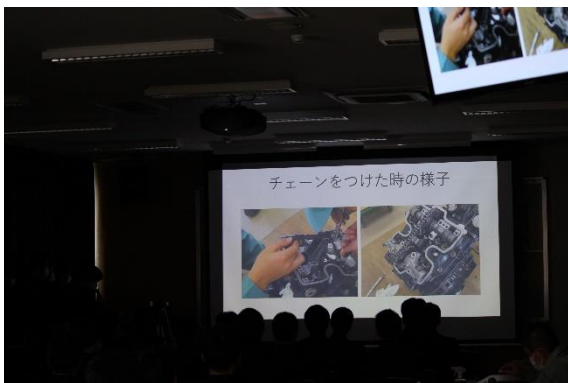
A 班 エンジン組み立ての様子