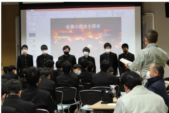
E 班 質疑応答の様子