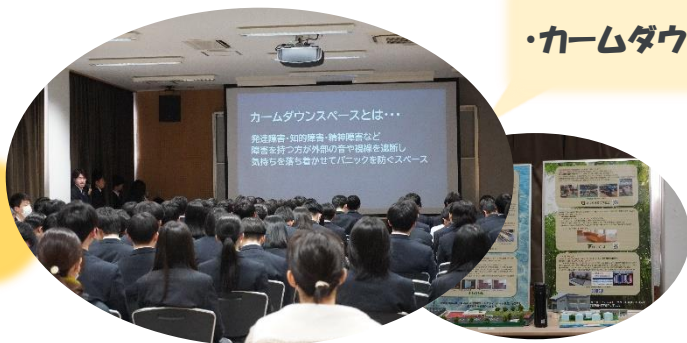
・カームダウンの研究・開発 ～出雲空港への設置～

今回はその成果を保護者、建築科の1,2年生に披露し、1年間の取組みを伝えました。発表会にお越しいただいた保護者の皆様、研究にご協力頂いた企業、団体の皆様、ありがとうございました。