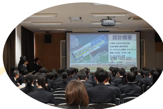
若者の県外流出を防ぐための手立てを建築の視点で考える