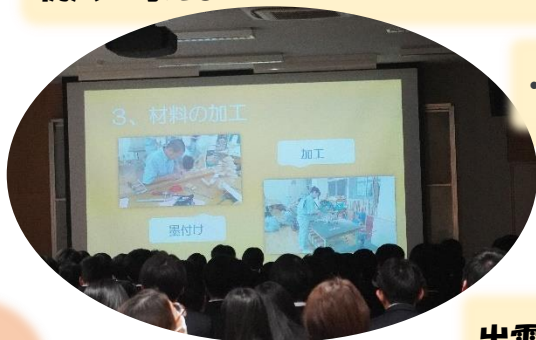
・出エビフォーアフター