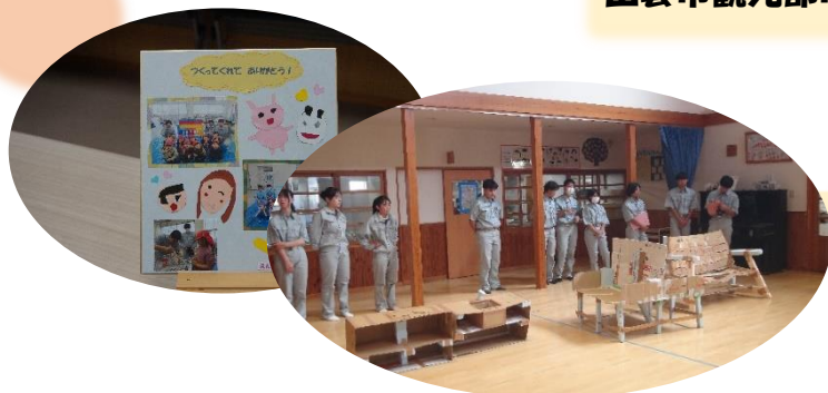
・市内施設(保育園等)への作品提供